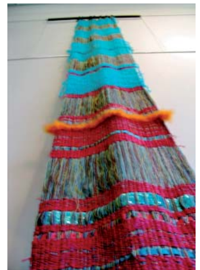
Pièces Tissées V. Maniglier